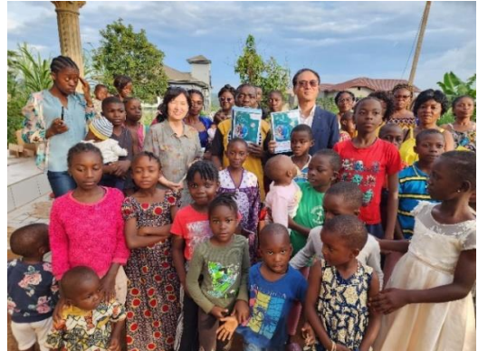
(야운데 은꼴루 교회 방문, 우물지역 봉헌식후에)

학교를 통해 청소년들을 잘 세우는 일들을 하려고 합니다. 많이 관심을 가져 주시고 기도해 주십시오. 이 땅이 하나님의 땅으로 거룩하게 성별 되어 요셉의 땅과 같이 꿈과 희망을 심고 거두는 복되고 기름진 땅이 되기를 기도하고 있습니다.