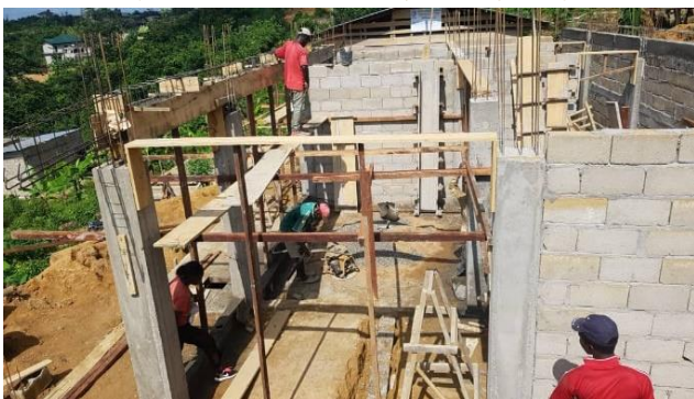
(NGOMA 고마 교회 건축 PK19 두알라)

아무것도 없던 이곳에 예배장소가 건축되어지고 지하수가 시추 되고 하나씩 예배할 준비를 갖추는 모습을 보며 학생들로 가득 찰 예배당을 생각하니 너무 기쁩니다. 건축이 잘 마쳐져 귀한 청년들의 꿈 터가 되기를 기도합니다.