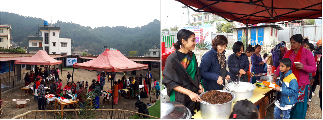
학교 건축비 마련을 위한 바자회